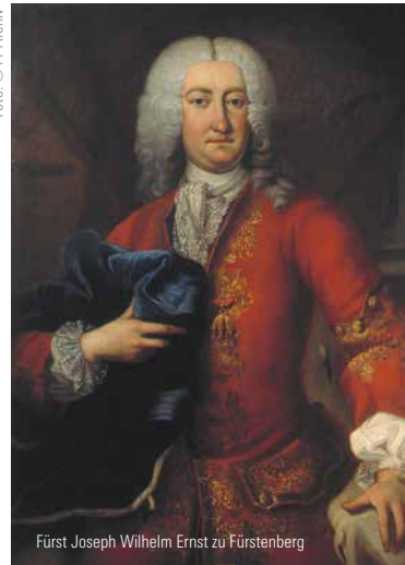
Fürst Joseph Wilhelm Ernst zu Fürstenberg